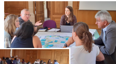
Atelier départemental pour la nature et la biodiversité